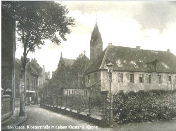
Kloster im Jahre 1872